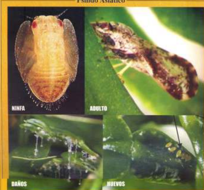
Diaphorina citri , el Psílido Asiático de los Cítricos