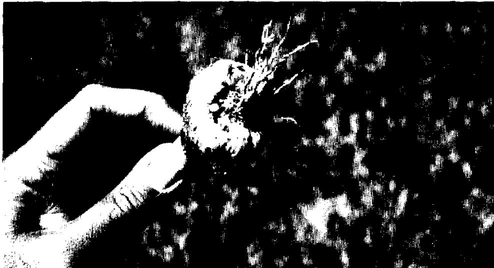
Podredumbre de la base del bulbo de ajo causada por ácaros y el nemátodo Ditylenchus