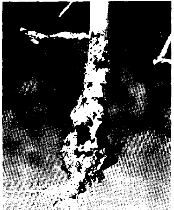
Ataque por Sclerotium cepivorum