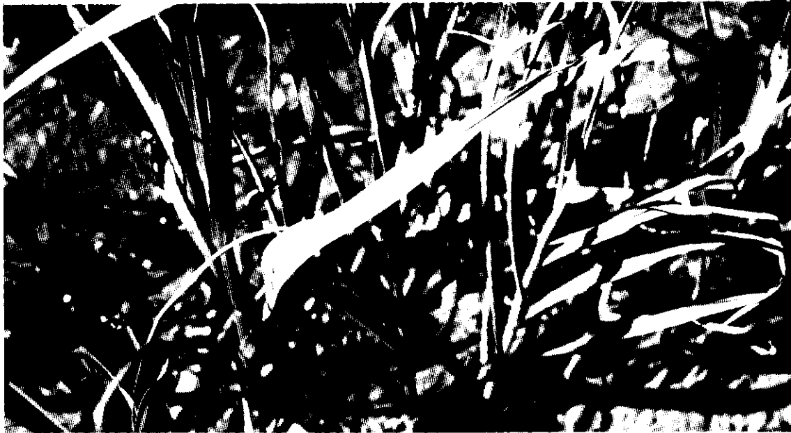
Síntomas de mancha púrpura causadas por Alternaria porri

hace usando productos cúpricos, ditiocarbamatos o azufrados, al principio de la enfermedad. Se han obtenido buenos resultados usando Methalazil+Mancozeb, Zineb, Triadimefon y Oxicarboxin, entre otros.