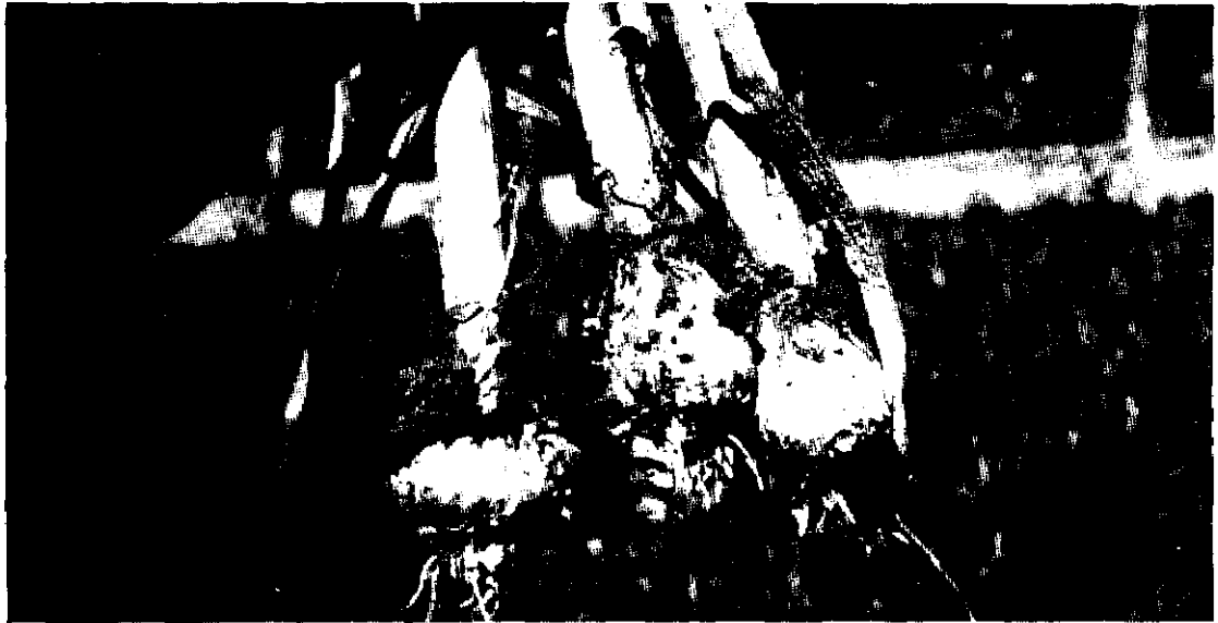
Ataque por Botrytis sp