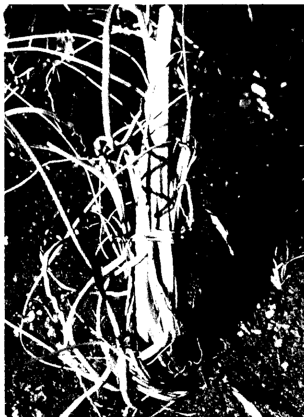
Ataque por Ditylenchus dipsaci

suelto. También puede presentarse enanismo, manchas de color amarillo claro y el follaje muere progresivamente. Las medidas de control más comunes consisten en usar cultivares resistentes y hacer rotación de cultivo.