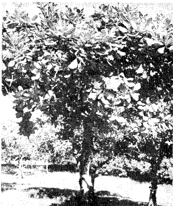
Desarrollo ideal de un árbol de cajuil a través del uso de poda

Se ha determinado que un árbol de cajuil tiene una vida económica de 40 años, aunque puede vivir mucho más. Su follaje, si está sano, es tan denso que puede impedir el desarrollo de otras plantas debajo de él. Tomando en cuenta la periodicidad de las lluvias, en el país se pueden estimar dos o tres brotaciones de crecimiento por año.